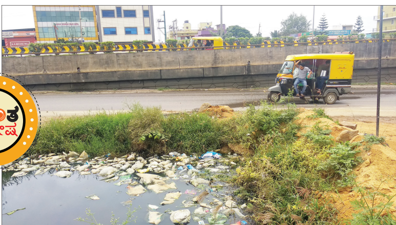
ನಿಲಮಂಗಲ ಪಟ್ಟಣದ ಪುರಸಭೆ ವ್ಯಾಪ್ತಿಯ ರಾಷ್ಟ್ರೀಯ ಹೆದ್ದಾರಿ ರಸ್ತೆಗೆ ಹೋಟೆಲ್ ಹಾಗೂ ಸರ್ವಿಸ್ ಸೆಂಟರ್‌ಗಳ ಗಲೀಜು ನೀರನ್ನು ಹರಿಯುತ್ತಿರುವುದು.

ನಿಲಮಂಗಲ: ರಾಜ್ಯ ರಾಜಧಾನಿಗೆ ಹೆಚ್ಚಾಗಿ ಲಾಗಿರುವ ಪಟ್ಟಣ ಸಮೀಪ ಎರಡು ರಾಷ್ಟ್ರೀಯ ಹೆದ್ದಾರಿಗಳು ಹಾದುಹೋಗುತ್ತಿದ್ದು 15ಕ್ಕೂ ಹೆಚ್ಚು ಜಿಲ್ಲೆಗಳಿಗೆ ಸಂಪರ್ಕ ಕಲ್ಪಿಸಿದೆ. ಇದರಿಂದ ಹೆದ್ದಾರಿಯುದ್ದಕ್ಕೂ ಅಕ್ರಮ ಮತ್ತು ಸ್ವಾಮ್ಯಾಧಿಕ್ಯ ಹೋಟೆಲ್ ಗಳು, ಲಾಡ್ಜ್‌ಗಳು, ಬಾರ್‌ಗಳು, ಗ್ಯಾರೇಜ್, ಸರ್ವಿಸ್ ಸೆಂಟರ್ ತಲೆಎತ್ತಿದ್ದು ಸಾರ್ವಜನಿಕರಿಗೆ ಅನುಕೂಲಕರವಾದ ಸಮಸ್ಯೆ ಹೆಚ್ಚಾಗುತ್ತಿದೆ.